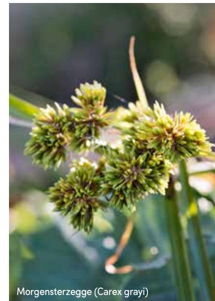
Morgensterzegge (Carex grayi)