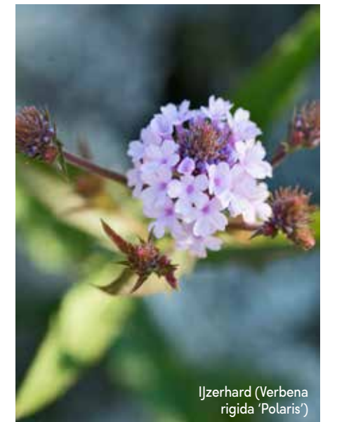
Ijzerhard (Verbena rigida 'Polaris')