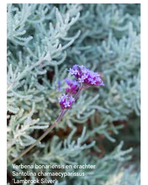
Verbena bonariensis en erachter Santolina chamaecyparissus 'Lambrook Silver'.