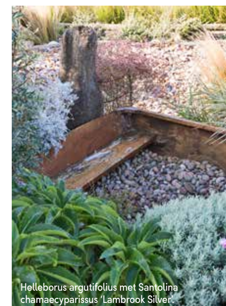
Helleborus argutifolius met Santolina chamaecyparissus 'Lambrook Silver'.