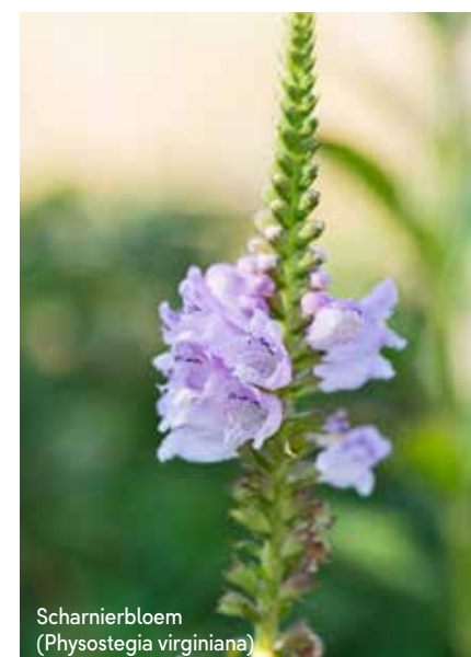
Scharnierbloem (Physostegia virginiana)