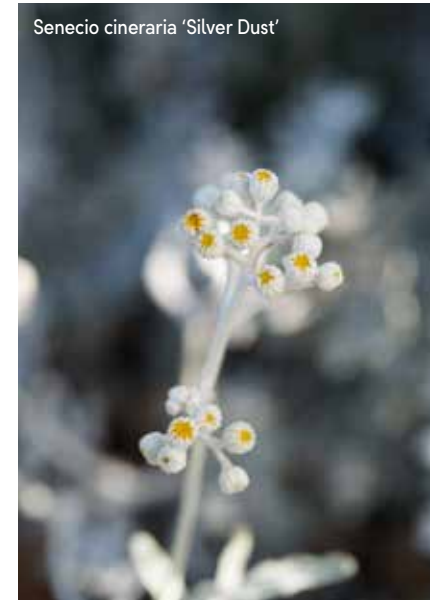
Senecio cineraria 'Silver Dust'

Grijsgroen, zilver en geel kleuren de kusttuin