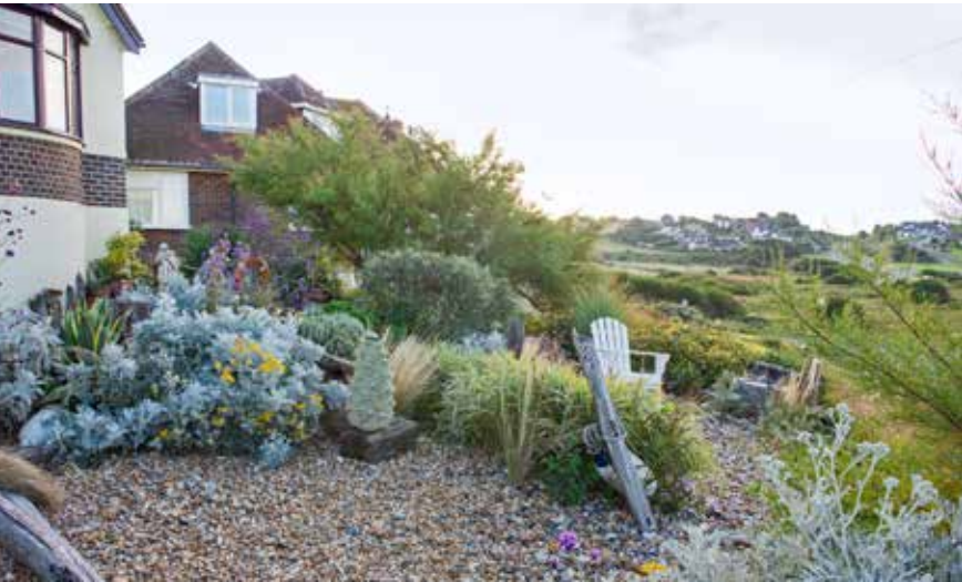
Geoffs gevoel voor compositie bleef niet onopgemerkt: tuin Driftwood is nu een succesvolle bezoektuin van de National Garden Scheme.