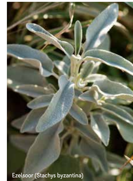
Ezelsoor (Stachys byzantina)