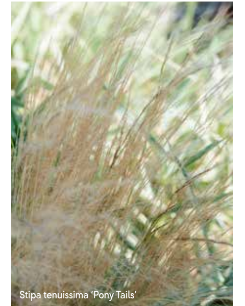
Stipa tenuissima 'Pony Tails'