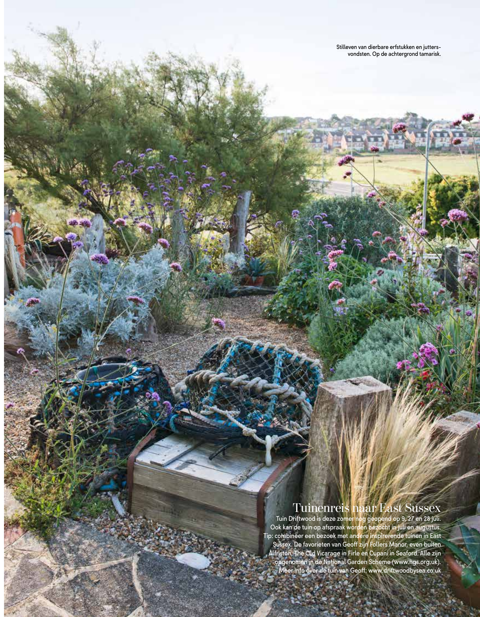
Stilleven van dierbare erfstukken en juttersvondsten. Op de achtergrond tamarisk.