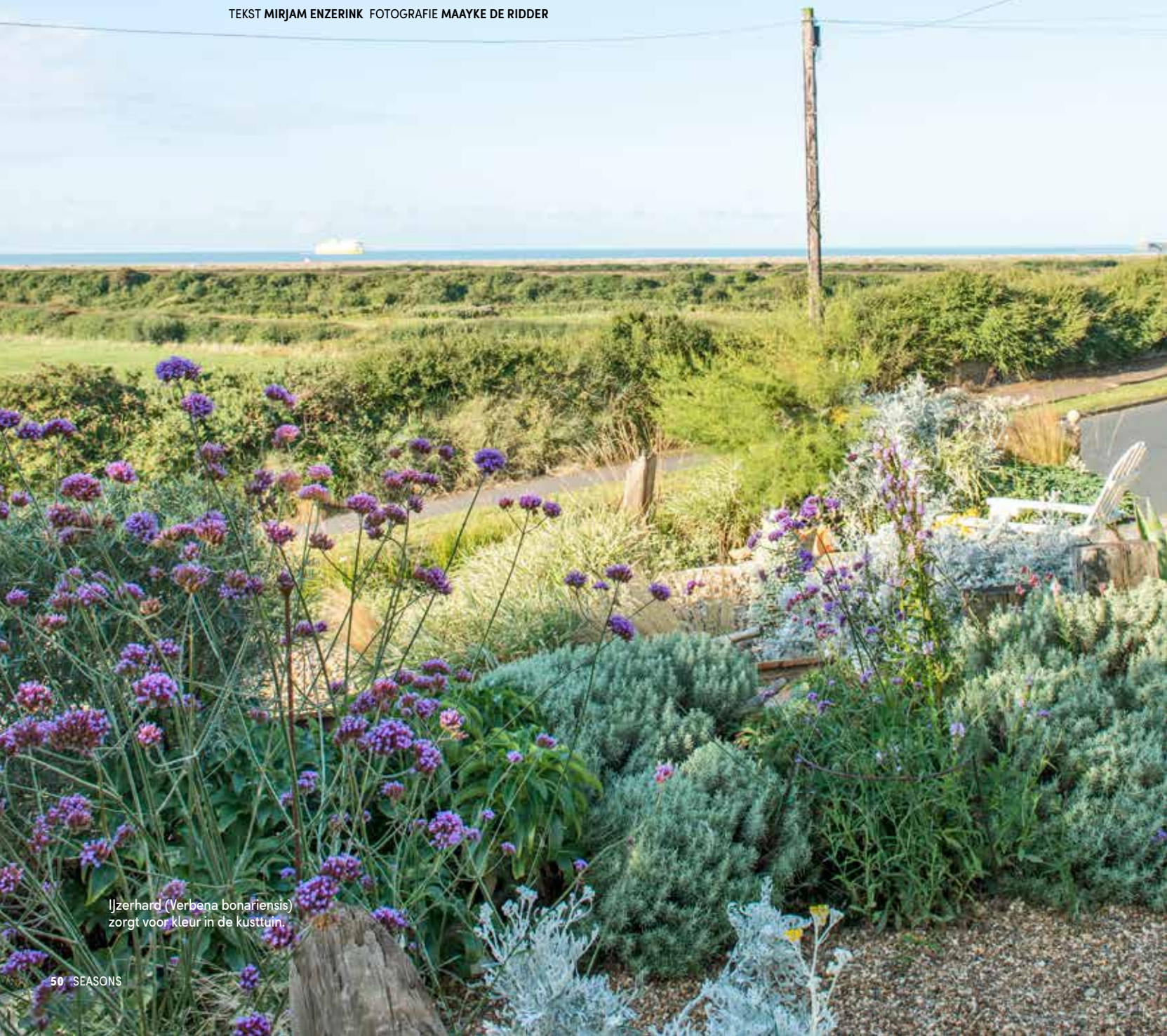
Ijzerhard ( Verbena bonariensis ) zorgt voor kleur in de kusttuin.

TEKST MIRJAM ENZERINK FOTOGRAFIE MAAYKE DE RIDDER